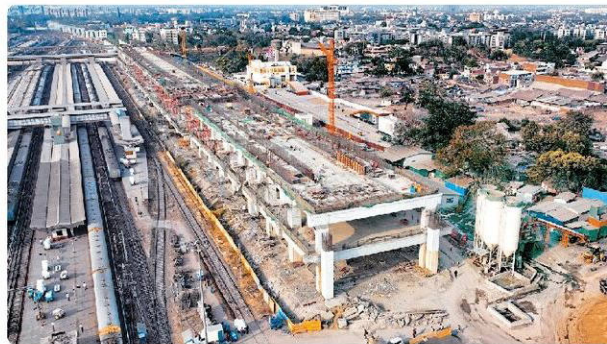
अहमदाबाद का निर्माणाधीन बुलेट ट्रेन स्टेशन।

बनाया जा रहा है। यहां 4 प्लेटफॉर्म होंगे। स्टेशन की ऊंचाई जमीन से 44 मीटर ऊपर होगी। फाउंडेशन का काम हो गया है। पहली मंजिल पर स्लैब निर्माण का काम चल रहा है।